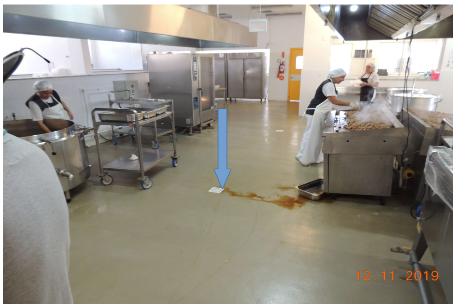
Ralo com saída lateral e profundidade de 40 cm.