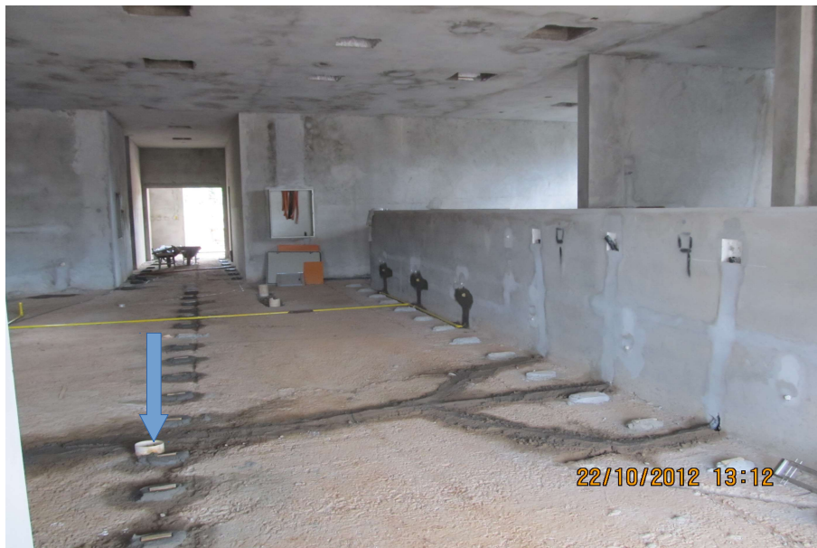
Tubulação de gás embutida no piso, próxima ao ralo.

Avenida Fernando Machado, 108-E, Centro, Chapecó-SC, CEP 89802-112, 49 2049-3113 seobras@uffs.edu.br , www.uffs.edu.br