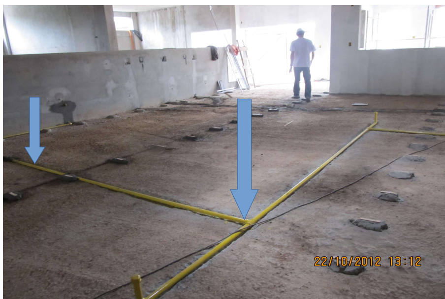
Tubulação de gás embutida no piso, próxima a grelha.