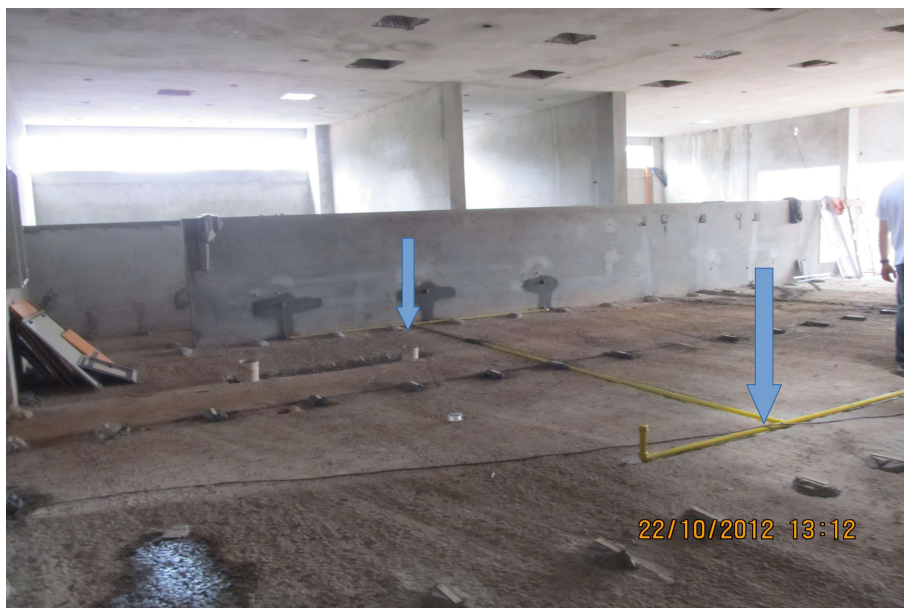
Tubulação de gás embutida no piso, próxima a grelha.