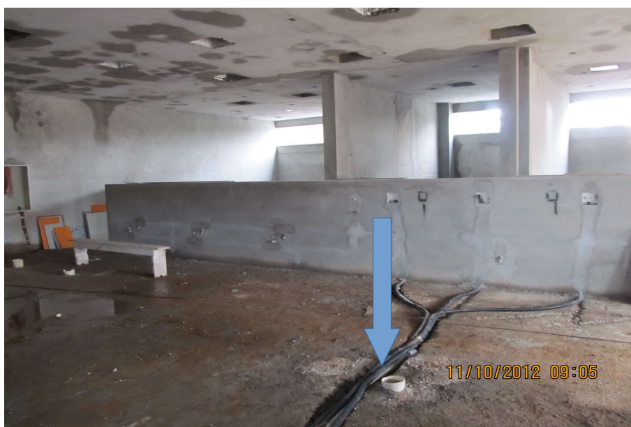
Eletroduto parte elétrica embutido no piso próximo ao ralo.